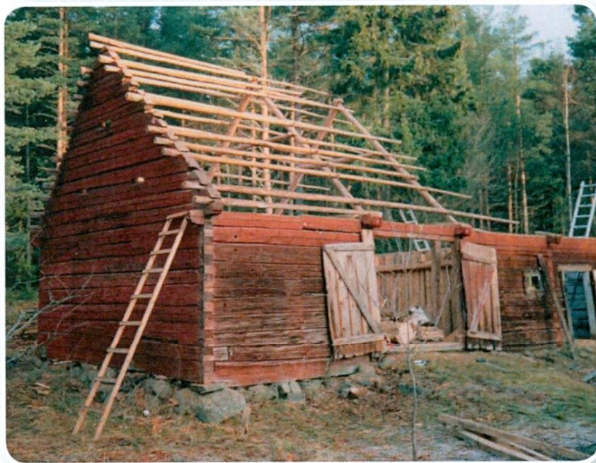
Nedplockning av ladan december 1994.

I en årsskrift från 1994, skriven av Roland Svärd, går det att läsa om hur Marbäcks hembygdsgård har fått en äldre ladugård från 1700-talets början skänkt av Greve Carl Bonde. Den kom ifrån Udden och var lite annorlunda i sitt utseende med timmer ända upp inock.