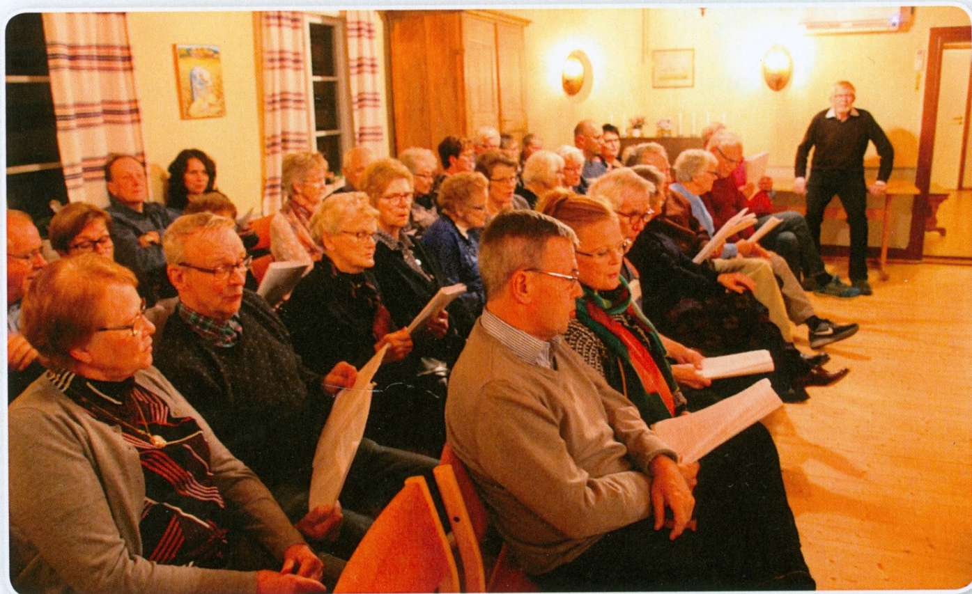
Publiken var med på noterna i allsången.