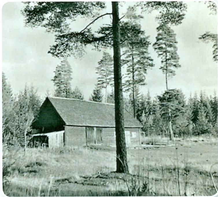
Ladan på sin ursprungsplats, Udden.

Det hela började med att Marbäcks hembygdsgård bildades den 11 maj 1936 på initiativ av kyrkoherde Wastesson. Den stora tomten med utsikt över sjön Ralången fick man skänkt av Greve Carl Bonde. Huvudbyggnaden köptes in och flyttades från Askeryds Prästgård. Två flygelbyggnader uppfördes, den ena kom från Klinten och loftsboden från Biarp. Portlidret på gården kommer ifrån Kopparp och bastan från Äng. Senare skulle även en ladugård komma att tillföras till gården.